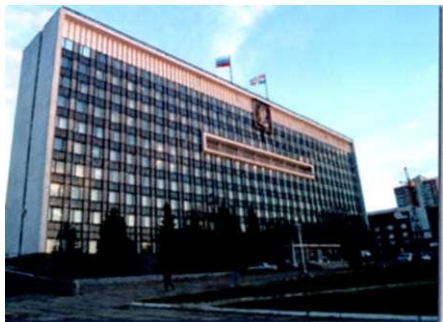
Здание Законодательного собрания в г. Перми