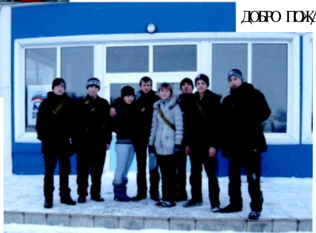
Команда Красноярской школы на соревнованиях I «Школа безопасности» в ФОК «Золотая Орда»