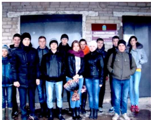
1 экскурсию в Совет депутатов