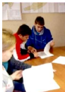
Знакомимся с Уставом поселения