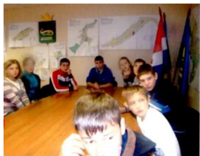
Зале заседания девятиклассники.