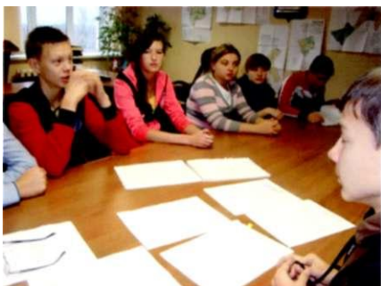
Изучаем решения Совета депутатов