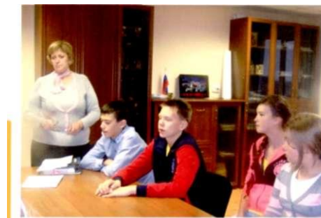
Елена Александровна рассказывает о работе депутатского корпуса

Она рассказала, что сегодня работает Совет депутатов 3-го созыва. Он рассматривает проекты законов и принимает их в первом чтении, кроме Устава и бюджета поселения. После чего решение отправляется на проверку в министерство юстиции ПК. В СД создано 2 комиссии по социальной политике и по бюджету. Мы познакомились с многими решениями: Уставом поселения, решением о газификации села Красный Ясыл, решением о строительстве хоккейной коробки, решением о награждениях. Мы полистали Бюджет поселения на 2014 год и протоколы СД. Мы посидели на местах настоящих депутатов и выбрали своего временного главу.